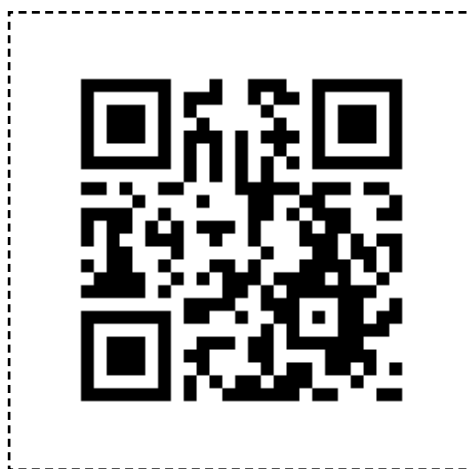
Placeres ved Post 5